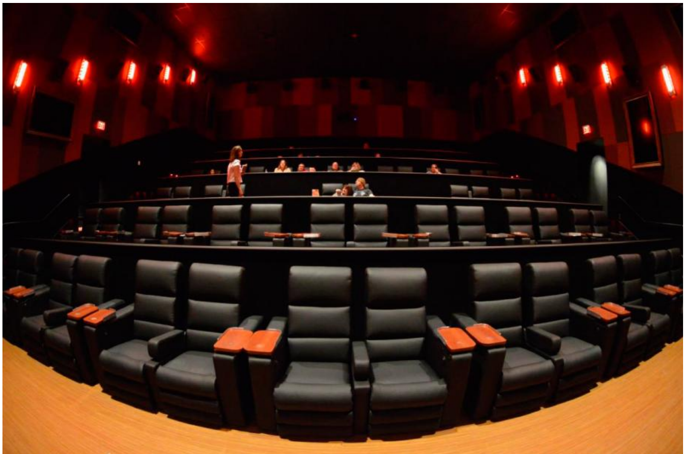
Modelo: S3100 Sun City en CINETOPIA y Look Entertainment (USA)